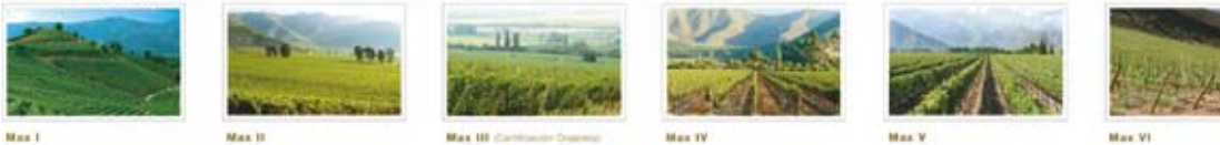
De zeven 'Max' wijngaarden liggen op een hoogte van 600 meter, 60 km noordoostelijk van de hoofdstad Santiago.