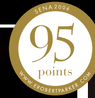
2006 Seña Hillside Vineyards in the Aconcagua Valley