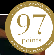
2006 Viñedo Chadwick Paternal Domain - Maipo Valley (100% Cabernet Sauvignon)

Van het ouderlijke domein in de buitenwijken van Santiago komt deze grandioze icoon-wijn. Robert Parker gaf hem maar liefst 97 punten. De kleur is diep kersenrood met een purperen gloed. Na even contact met de zuurstof in de lucht geeft het bouquet fruittonen van bosbessen en bosaardbeitjes. Ook nuances van tabak, vers geroosterde koffiebonen, pure chocolade, truffel, cederhout en zwarte peper. Op de tong komt het fruitkarakter sterk terug met een vleugje karamel van de houtopvoeding. De finale is grandioos. Beperkt leverbaar. Volmaakt rijp in 2015, blijft zo tot 2023.