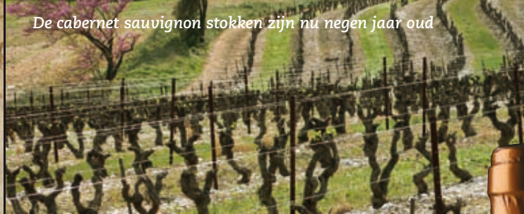
De cabernet sauvignon stokken zijn nu negen jaar oud